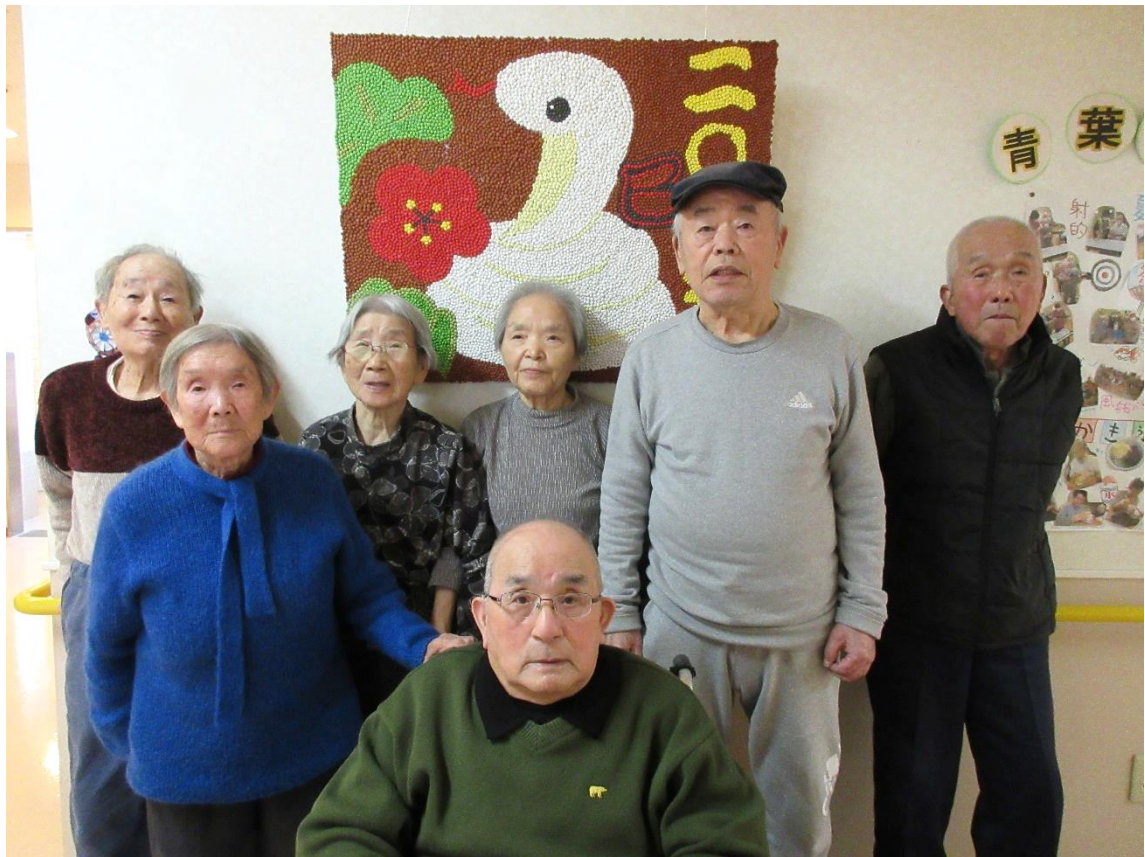
*通所のご利用者様と今年の干支巳の壁画*