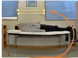
黄色の枠が感知エリア

黄色の長方形の枠を感知エリアに設定。感知エリアはパソコンで足元などどこにでも、又いろいろな形、サイズに設定できます。